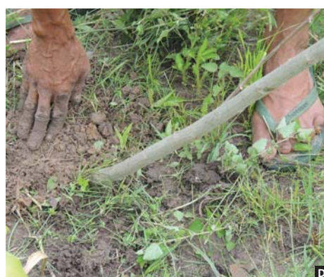
Figura 1. Obtenção e plantio de estacas de sombreiro. (A) Corte dos galhos selecionados com tesoura de poda para evitar rachaduras. (B) Escavação da cova com alfanje. (C) Estaca sendo colocada inclinada na cova. (D) estaca já calçada para melhorar o pegamento.