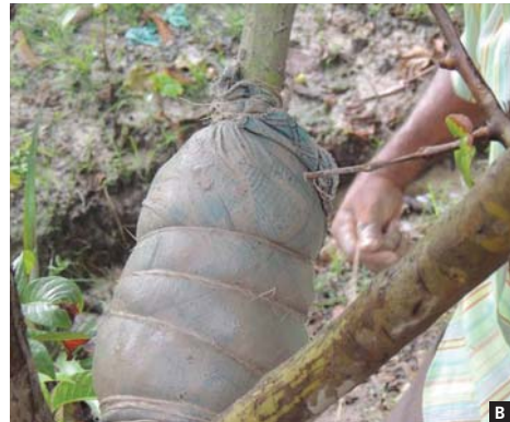
Figura 3. Terminando a “engessação” (A) amarração das pontas do pano com um arame e (B) voltas de arame no tecido para firmar a terra.