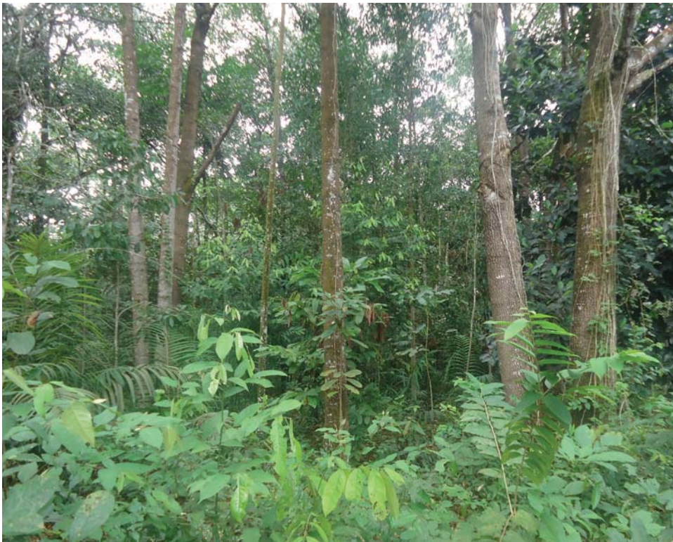
Figura 1. Aspecto do Sistema Agroflorestal clima da mata.

Após 27 anos da semeadura da primeira árvore, Damião maneja o quintal cortando árvores para madeira e lenha, mas sua atividade é basicamente colher frutos e despulpá-los e vendê-los em sua própria residência. Há dois freezers em sua casa que armazenam as polpas de cupuaçu, bacuri e outras.