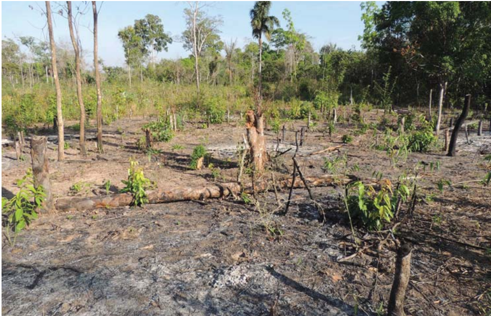
Figura 4. Área queimada no veranico para implementação da roça com a permanência de algumas árvores e com troncos cortados com um metro de altura para possibilitar rebrota.

A queimada é realizada no veranico, que pode ser em janeiro, fevereiro ou março. Essa prática visa preparar a área para o primeiro plantio que é realizado no início da próxima estação chuvosa, podendo ser em setembro, outubro ou novembro. Durante esse período, pode haver brotações e para isso o agricultor faz a última roçada. “Faço uma roçada quando o braquiarião está meio verde. Aqui tem muitas outras coisas que não é só o braquiarião, a lavagem-de-macaco, vários cipós, então dou uma roçada”. Esse processo se faz para que as plantas maiores não atrapalhem o desenvolvimento da lavoura branca.