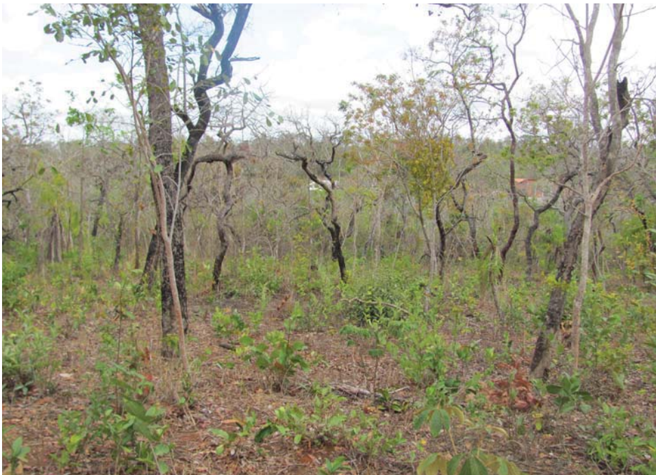
Figura 4. Abertura de pastagem com presença de árvores nativas do cerrado no período de seca.

Cristovino destaca que “debaixo dos pés de pequi, a braquiária é mais verde o ano todo. Mesmo quando o tempo está seco ela conserva mais. Não que você vá deixar uma área fechar toda, porque aí não vai ter jeito do capim se desenvolver. Mas o capim não precisa de 100% de luz, pode deixar lá uma boa parte de sombra”. Cristovino afirma que “o capim que vai melhor