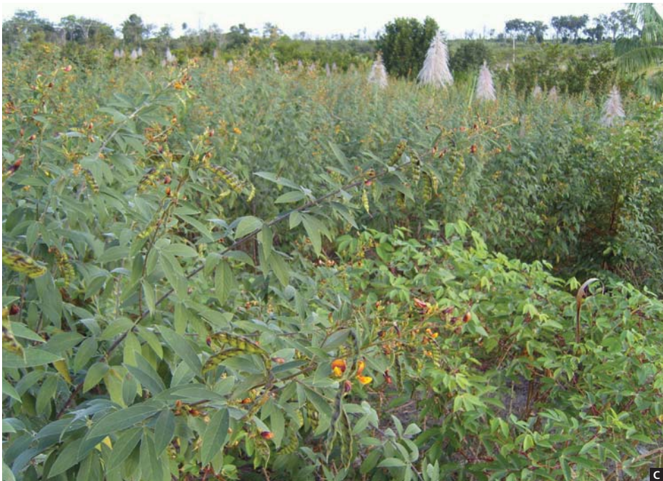
Figura 1. Casadão do brejo, (A) buriti coberto pela água no período chuvoso. (B) Cupuaçu teve que ser protegido por palha depois que o guandu secou, (C) guandu protegendo do sol as árvores mais sensíveis.