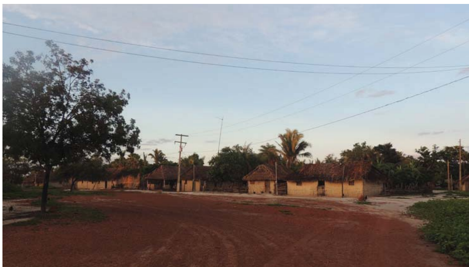
Figura 1. Amanhecer na comunidade Buriti Corrente, Codó Maranhão.

A comunidade de Buriti Corrente é uma área de conflito pela posse da terra. A área era propriedade de uma empresa que a utilizava para turismo, produção de cana-de-açúcar e gado. A empresa decretou falência na década de 1970 e, a partir desse período, a área começou a ser ocupada pelas famílias agricultoras que nela residem até hoje. Os conflitos pela posse entre os agricultores e os empresários se iniciaram em 2009 e no ano seguinte os proprietários receberam autorização para a retirada das famílias da área. Naquele momento, as casas, escolas e plantios foram destruídos e as famílias realocadas para o outro lado da rodovia, área que eles já utilizavam para o plantio de mandioca, melancia e outros cultivos.