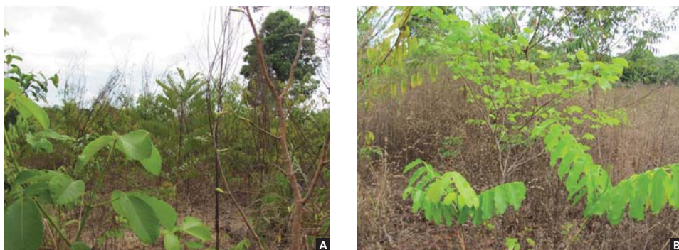
Figura 1. Plantio de árvores nativas e adubação verde utilizando a técnica da muvuca com densidade de 30 espécies por metro quadrado. (A) Plantio realizado em 2008 e (B) plantio mecanizado, realizado com calcareador Vincon em 2009.

A densidade do plantio com a muvuca de sementes é alta porque busca imitar a regeneração natural de uma floresta, em que a densidade de sementes e plantas novas é alta no início e decresce com o tempo. Desta forma, esta técnica prevê que morram muitas plântulas no estágio inicial, mas que são importantes para impedir que plantas não desejadas ocupem a área, e que a estrutura da vegetação siga caminho similar a clareiras em florestas naturais. Seu Amandio compartilha este raciocínio, pois a redução da densidade já é observada por ele nos plantios mais antigos. “Tem muitas