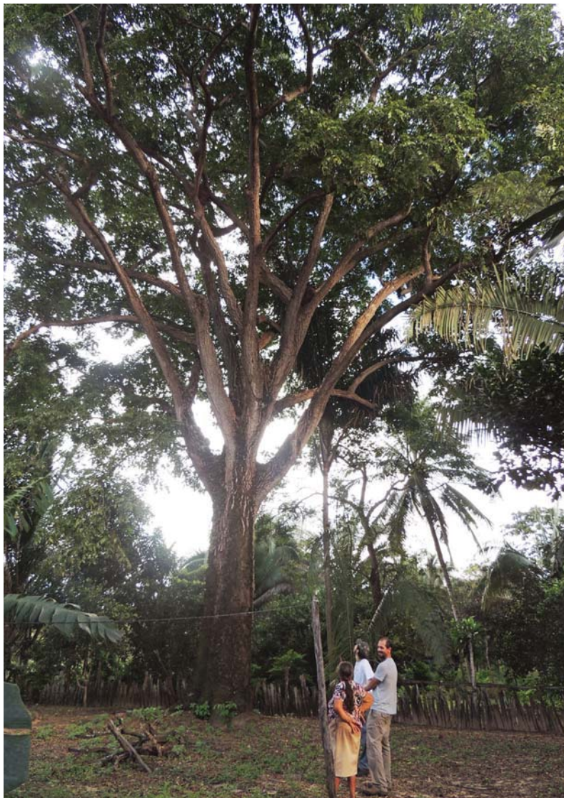
Figura 1. Árvore de cajá na propriedade de Dona Lourdes. Desta árvore, foram colhidos 1.000 kg de frutos em um ano.

vista dos Pequenos Produtores de Carolina (AAPPC), para a produção de mudas e as frutas foram vendidas in natura para a fábrica de polpas Fruta Sã. “Do bacuri eu fiz a conta. Deu 518 quilos de polpa, vendido cada quilo a R$ 10. Ano passado, de cajá deu 1.000 quilos de fruta de um único pé (Figura 1). E não sobra não”.