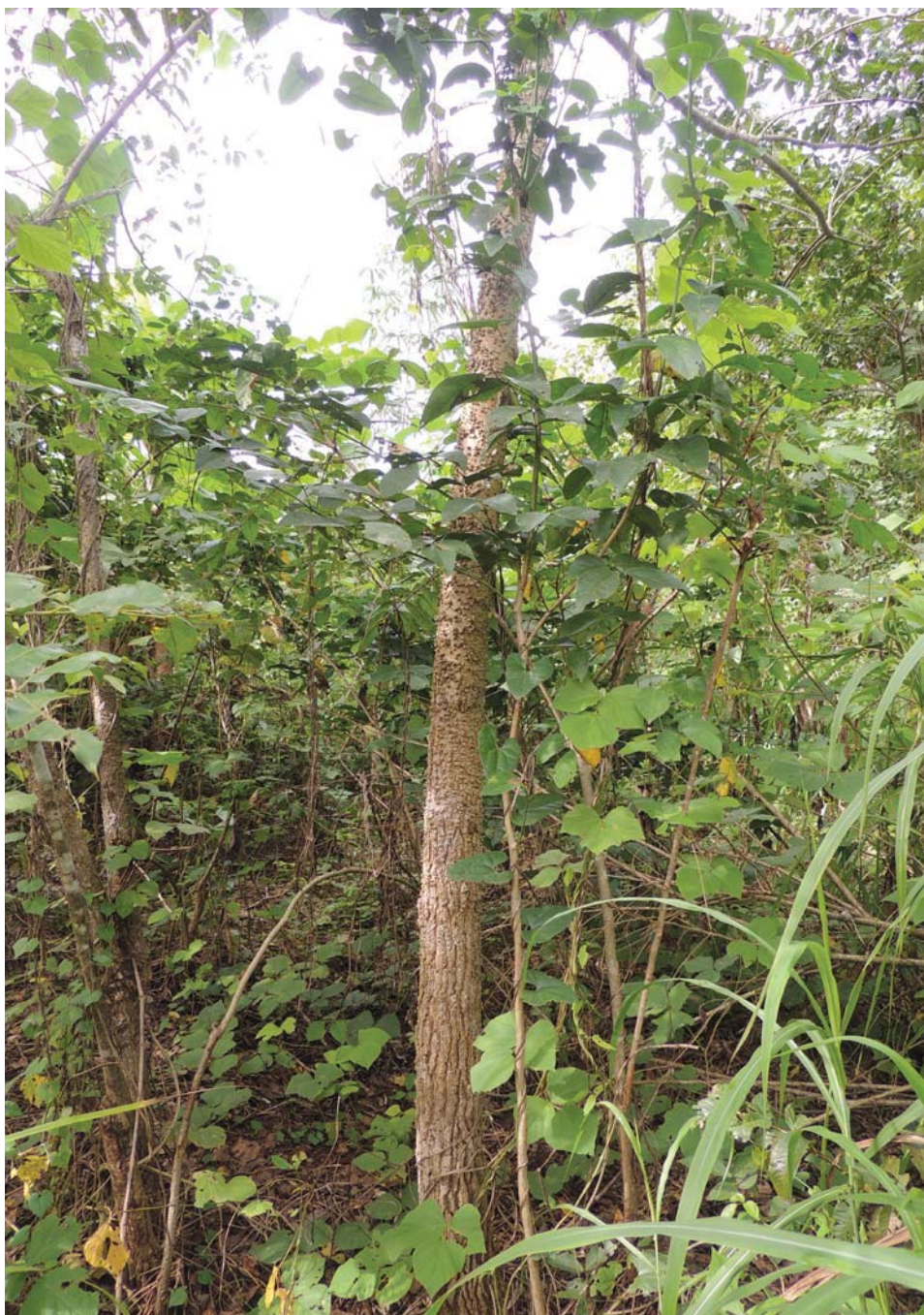
Figura 2. Cajá plantado a partir de estaca de 1,5 metros, retirada do caule de uma árvoreta.