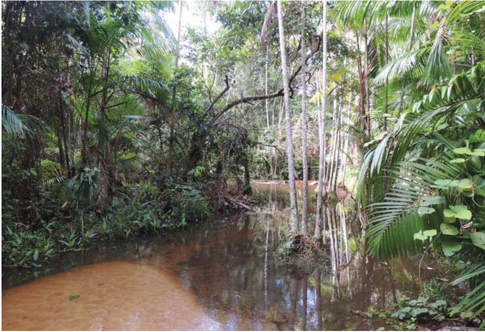
Figura 1. Margem de um rio onde há 11 anos foi realizado o último plantio de mandioca, recuperado com plantas nativas como o cupuaçu e açaí e voltou a correr água permanentemente.

a permanência de alguns animais que sobrevivem das frutas. Isso foi feito utilizando as plantas da região, que não precisam de tanto cuidado, de tanta técnica e habilidade, porque o povo já vinha trabalhando com elas, sabia a forma de colher, manipular. Boa parte dos sítios [área ao redor da casa em que a família planta árvores] mais novos surgiram do Proambiente pra cá. Alguns abriram mão até da pastagem do gado pra manter também essa idéia da preservação. Têm alguns agora que estão começando a colher. Alguns passaram a plantar açaí e vão colher esse ano”.