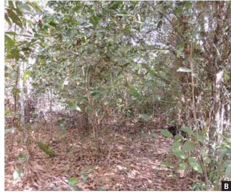
Figura 3. Comparação entre áreas de plantio. (A) plantio de roça seguida de regeneração natural. (B) área de plantio com manejo e inserção de árvores.