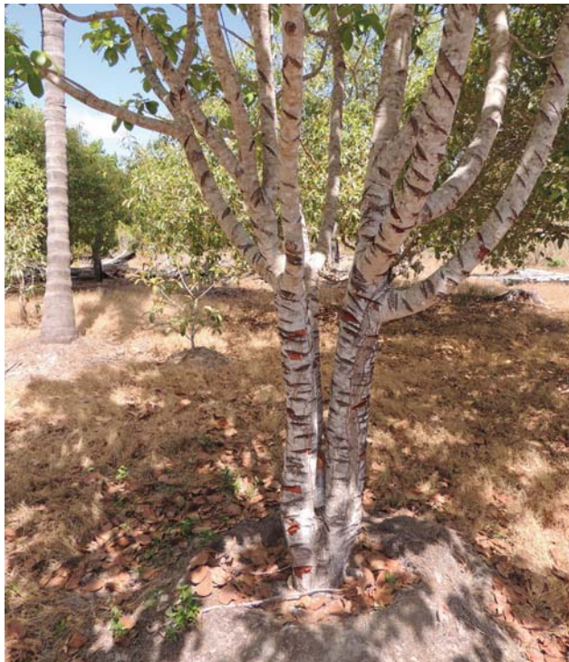
Figura 4. Cortes no caule da mangabeira, realizados 3 dias antes da lua cheia, para estimular crescimento e produção de frutos.

“A mangaba tem que cortar ela e deixar sair o leite. Corta três vezes ao ano, de quatro em quatro meses. Quando ela começa a alisar o tronco, tem que cortar. Tem que cortar antes da lua cheia, três dias. Ela não cresce muito, produz bastante. Esse pé de pequi também, na lua cheia três vezes ao ano” (Figura 4).