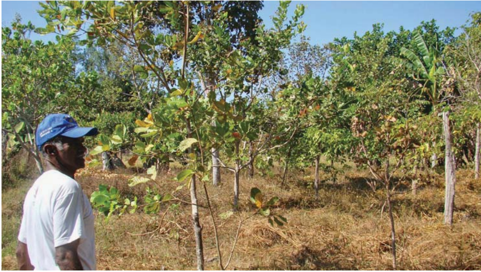
Figura 5. Casadão do sítio Boa Sorte. Plantio de árvores nativas com caju, depois de ter colhido as plantas de ciclo curto e incorporado a adubação verde.

you cut and the leaves dry and rot; and it grows again. The plant fertilizer fights this mat more low. When she reaches a certain point, you can cut, that is to see if she is suffocating some seedling. Rotates quickly, she is the fertilizer". The fertilizers also prevent the entry of capim. "Here I will not count on mixing. For this, I will plant mucuna and crotalaria, because mucuna does not let the grass grow, and it is easier to pull it out of the foot of the seedling than the braquiaria". João Bode defends the use of mucuna because for him it is much easier to control the mucuna than the braquiaria.