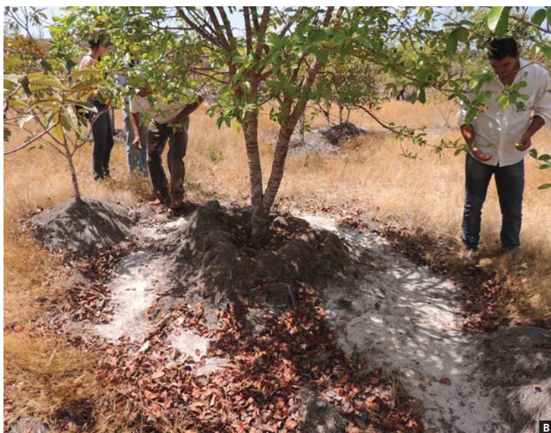
Figura 3. Adubação orgânica no pé das árvores adultas e jovens, composta por feijão-deporco, capim e serragem crua. (A) Adubação orgânica no período de chuva e (B) no período de seca.