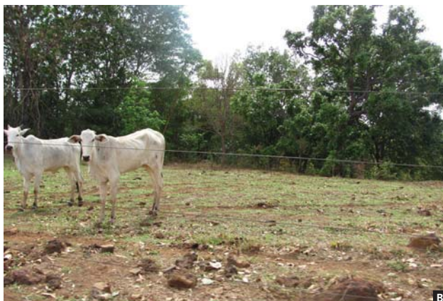
Figura 2. (A) Trator puxando uma grade fechada cobrindo (incorporando) a muvuca. (B) Animais pastando para evitar que o capim floresça e disperse sementes.