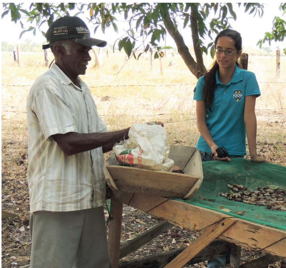
Placides com sementes de caju que beneficiou para a venda a Rede de Sementes do Xingu.

Silva, C. E. M. 2009. O cerrado em disputa: apropriação global e resistências locais . Brasília: Confea, 2009. 264 pp.