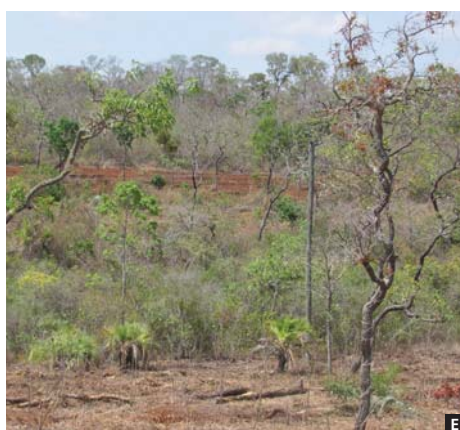
Figura 1. Agrofloresta de tabuleiro: (A) linha de abacaxi em espaçamento 1 \times 0,3 metros, (B) consórcio de abacaxi, mandioca e feijão guandu no período de seca. (C) Plantio visto de cima. (D) Linhas de abacaxi no meio da vegetação nativa do cerrado, (E) faixa com com vegetação nativa para evitar erosão.