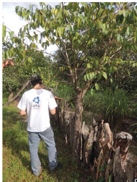
Figura 3. Criação de suínos em (A) mangueiro de 34 hectares com presença de árvores e brotos que geram frutos que servem de alimento para os animais. (B) Suínos de duas raças distintas para produção de banha e de carne. (C) Cercamento do mangueiro utilizando lascas de madeira retiradas durante a abertura de espaço no mangueiro.