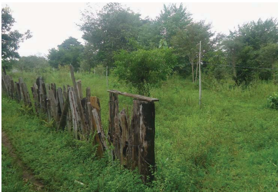
Figura 2. (A) Damião com frutos de bacuri. (B) Pasto com presença de árvores nativas.