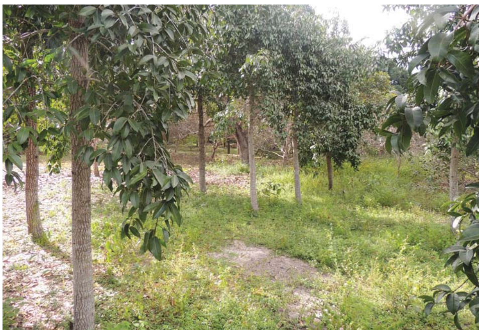
Figura 2. Árvores de bacuri originadas de rebrota de raízes a partir de árvores que foram cortadas e queimadas para estabelecimento da roça há mais de 5 anos. Foi feito o raleamento das rebrotas, deixando um espaço de 5 metros entre as árvores.