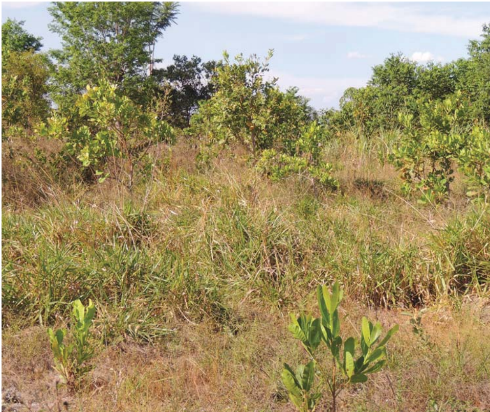
Figura 1. Área plantada com sementes obtidas nas proximidades do sítio.

Em outra área seca, Raimundo fez o plantio mais voltado para a produção de frutas para polpa. Foram plantados maracujá, com pequi e caju, tudo na mesma época com um espaçamento de 3 × 3 metros. “O pequi e o maracujá na mesma cova, o caju na outra e umas ramas de mandioca. Colhi muita coisa aqui, o pequi demora pra crescer e o maracujá morre logo”. Hoje é possível observar plântulas e arvoretas de muitas espécies que ocorrem em florestas próximas ao plantio.