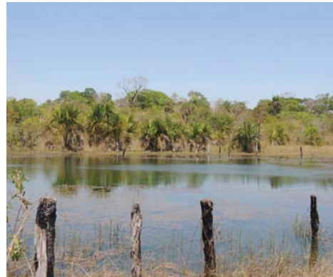
Figura 3. Cercas para evitar que o gado se aproxime das fontes de água para a recuperação da vegetação nativa como o plantio de buriti nas margens.