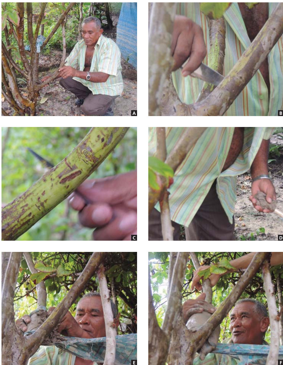
Figura 2. Procedimento de alporquia (clonagem). (A) Definida a árvore-mãe, seleciona-se um galho com diâmetro médio de 5 cm e mais externo. (B e C) O galho selecionado deve ser raspado cuidadosamente para tirar a casca mais superficial da planta. (D) Com o galho raspado, prepara-se a terra, úmida o suficiente para grudar no galho raspado. (E e F) Com um pano de 1 metro x 0,5 metros faz-se voltas no galho para segurar as camadas de terra.