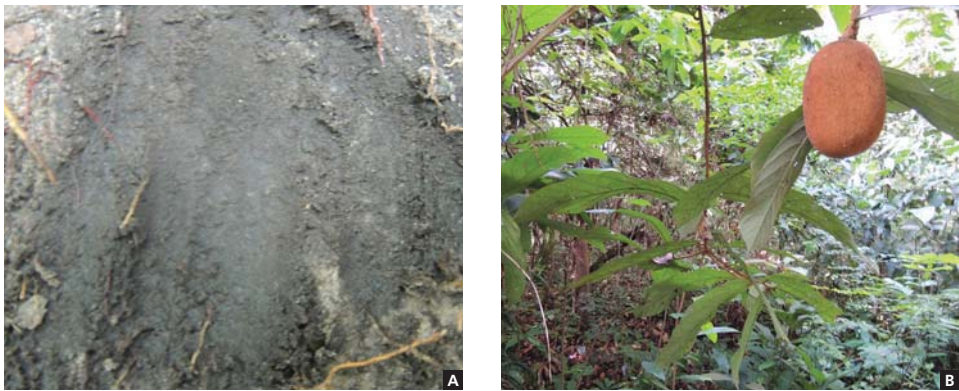
Figura 3. Enriquecimento de capoeira com cupuaçu. (A) Solo escuro característico da área. (B) Floresta regenerando com a inclusão do cupuaçu na sua sombra.

Uma planta que Bina aconselha plantar com o cupuaçu é o açaí. Entretanto, seu plantio é realizado alguns anos depois do cupuaçu, quando a capoeira está mais madura e a terra já está mais úmida. O açaí é plantado por sementes e por mudas. Bina avalia que “o açaí avança bem mais rápido do que o cupuaçu, então eles podem ser plantados próximos”.