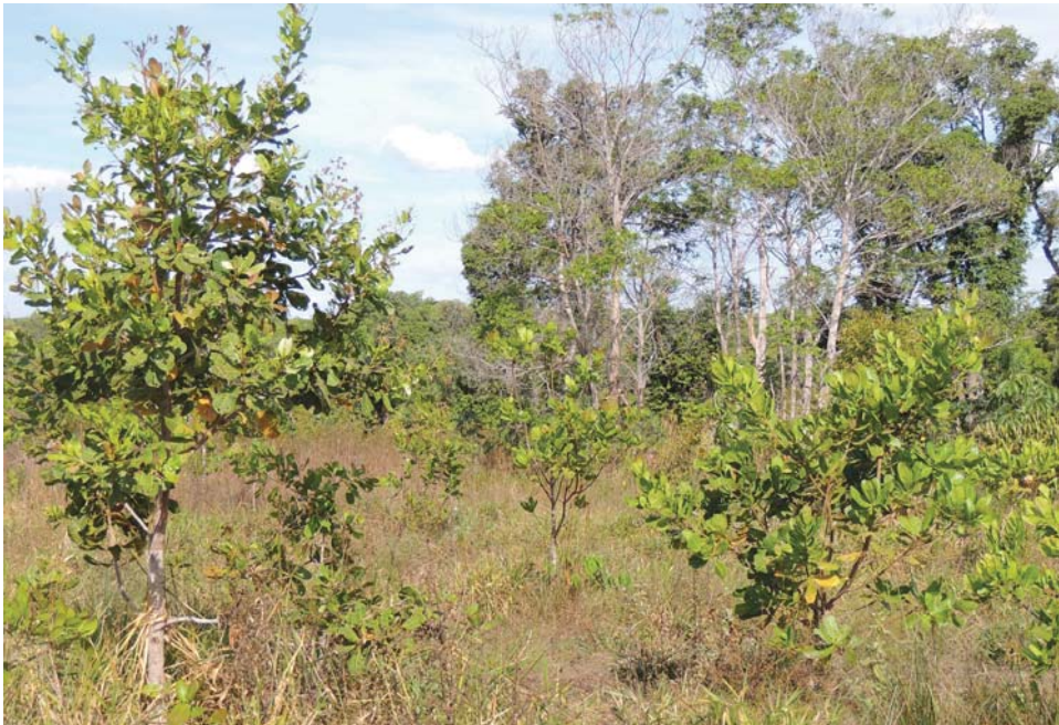
Figura 3. Árvores e brotos deixados durante a gradagem de renovação da pastagem, que agora fazem sombra e alimentam o gado.

Na limpeza do pasto, algumas árvores grandes e algumas rebrotas são eliminadas. O agricultor prefere manter árvores frutíferas e madeiras porque essas podem alimentar o gado, como o baru e as mirindibas, e também podem dar frutas e madeira. “Tem umas capoeiras que eu ainda tenho que arrumar, mas eu quero arrumar com o trator, tirar algumas árvores”. A seleção das árvores que serão cortadas é feita quando o trator prepara a terra, “pedi para o rapaz não cortar um ramo de marmelada, pé de murici, pé de sucupira, pé de mirindiba, pé de ipê, o que é da natureza é para deixar tudo. Uma árvore a cada 50 metros, é bom demais. Não impede o capim formar, ajuda a ficar mais úmido, na sombra o capim não seca, não fica esse solo velho estanhado [pobre e compactado]”.