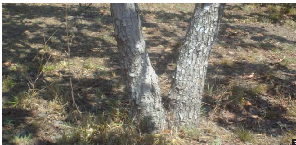
Figura 1. Sistema silvipastoril composto por pequizeiros e nas bordas cajueiros. (A e B) Plantio realizado com mudas no espaçamento de 10×10 metros com objetivo de criar animais. (C) dossel do plantio de pequizeiros. (D) Dois pé de pequi juntos resultado do plantio realizado por sementes. Nas covas são inseridas 3 sementes de pequi, quando brota mais de uma planta essa deve ser retirada para replantio antes que tenha 5 folhas.