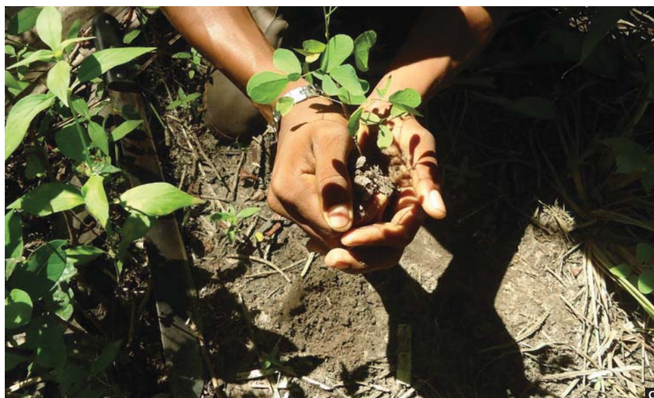
Figura 1. Plantio de sabiá em capoeira. (A) Linha de 5 x 0,5 metros plantada a 3 anos dentro da capoeira. (B) Plântula de sabiá com tamanho ideal para o transplante, (C) Escavação da plântula com pá de jardinagem aberta-se para formar o torrão que será plantado logo em seguida.