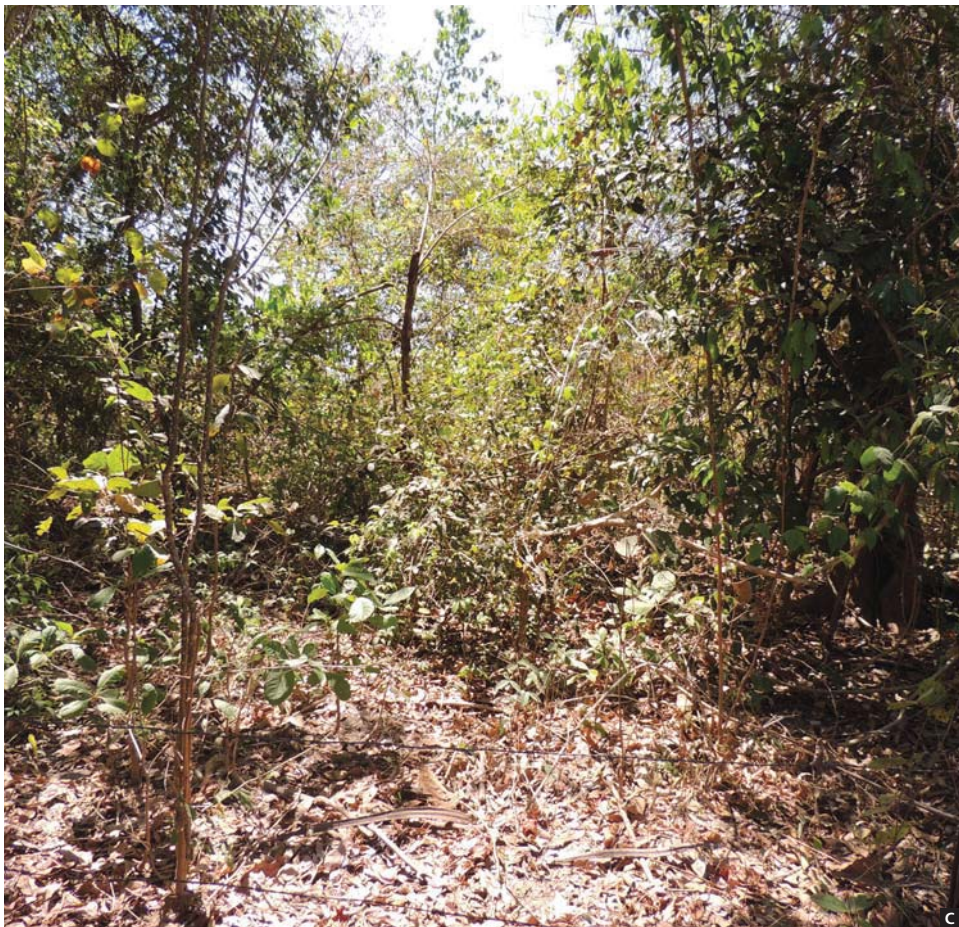
Figura 4. Para incluir árvores frutíferas de interesse primeiramente (A) as sementes são plantadas na sementeira. (B) As árvores nativas ajudam a criar condições para árvores mais exigentes e adubam o solo com as folhas. (C) Casadão do Sítio Três Irmãos com árvores nativas e exóticas frutíferas.