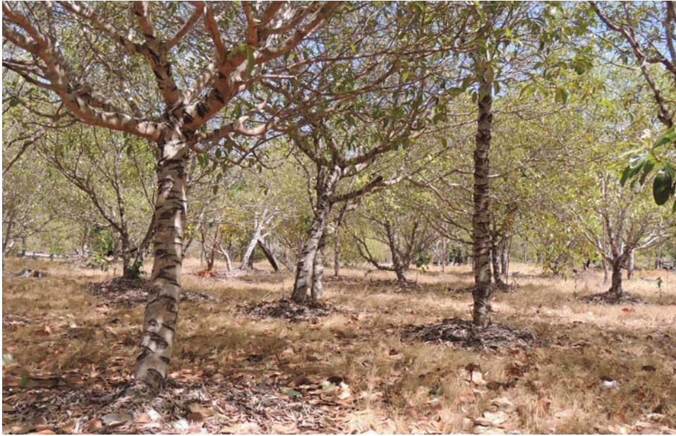
Figura 2. Casadão do Cerrado. Plantio de pequi, mangaba e murici com espaçamento de 6x6 metros.