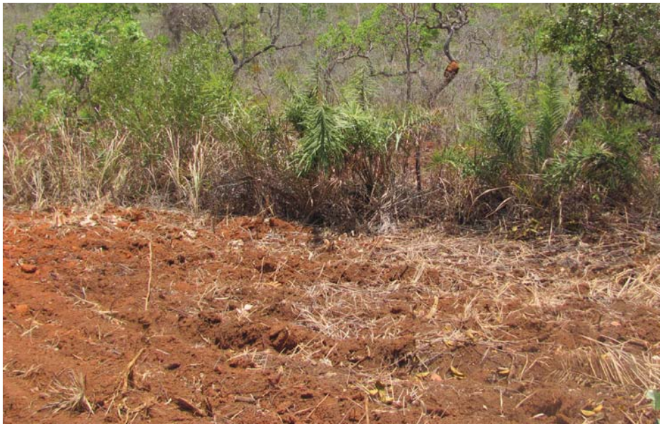
Figura 2. Preparação da área, árvores e palmeiras deixadas na roça, durante a gradagem

Para saber a quantidade de luz que deve entrar no SAF, Cristovino diz “isso é só no olhar mesmo, é mais ou menos. Está bom quando você poda e não tem sombra nenhuma. Mas na hora que as árvores folharem já vai ter sombra, aí você vê que precisa tirar algum galho, alguma coisa” (Figura 3). Para Altino, é importante considerar a exigência luminosa das espécies cultivadas para controlar a incidência de luz no SAF. “A mandioca, o milho e o feijão precisam de mais luz, então eu deixo poucas árvores”.