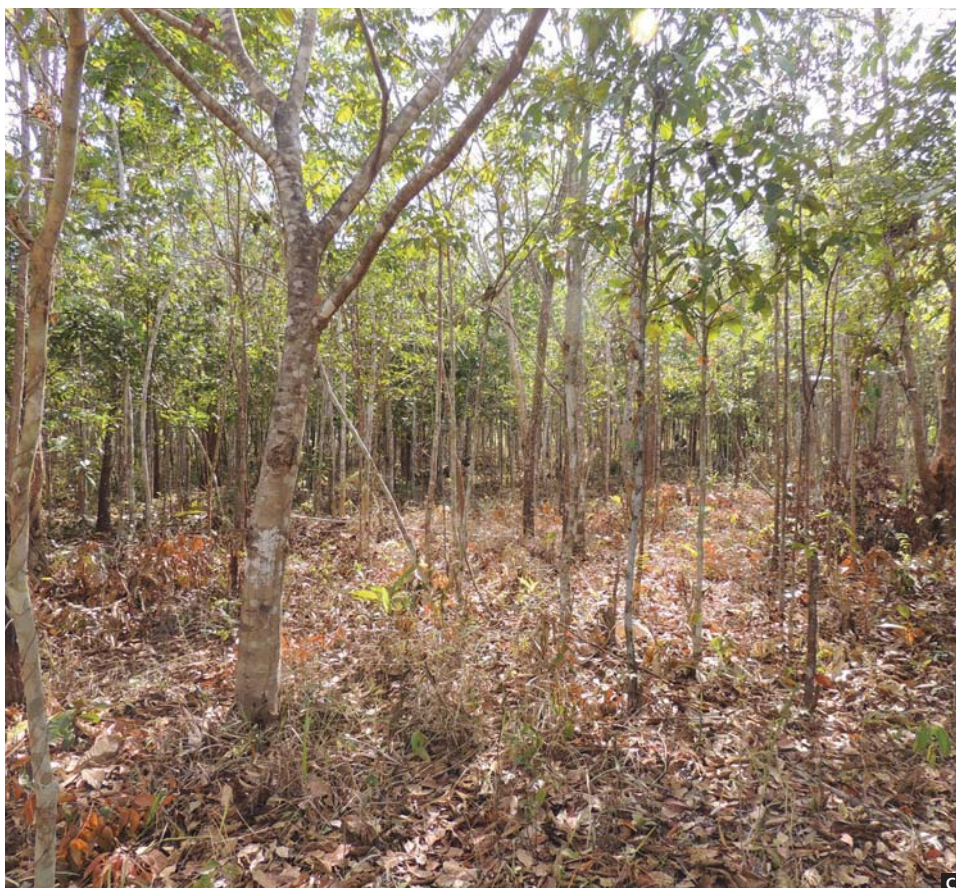
Figura 2. Evolução do Casadão. (A) área queimada no veranico da estação chuvosa para realizar plantio de mandioca, milho e feijão no próximo período chuvoso. (B) área plantada há um ano, produziu milho e mandioca junto com o desenvolvimento das árvores. (C) área com 5 anos mostrando árvores já desenvolvidas. Implantação do Casadão.