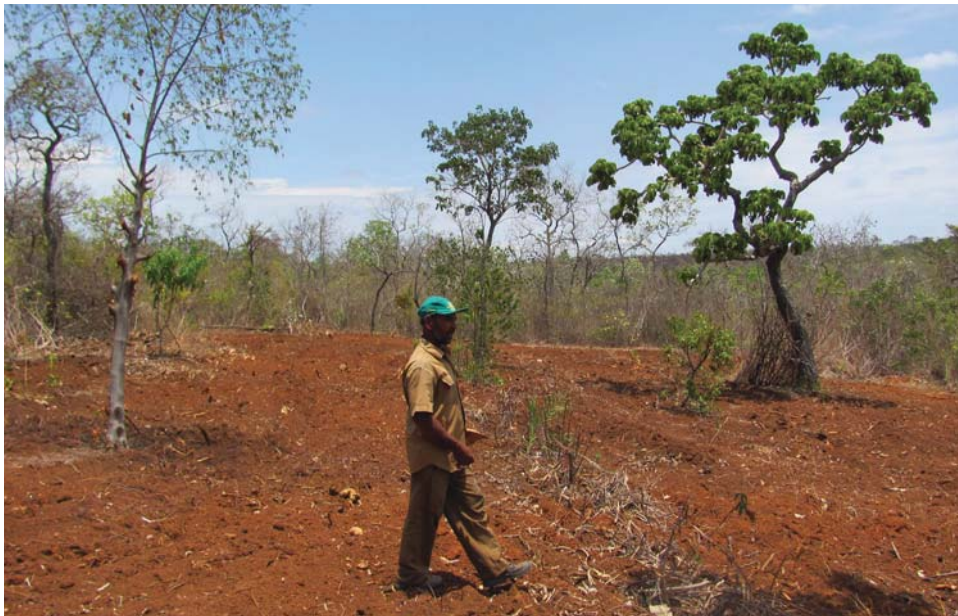
Figura 3. Limpeza do terreno, entrada ideal de luz para o funcionamento do sistema.

Sobre a importância de gradear o solo em um primeiro momento, Cristovino pontua que no primeiro sistema agroflorestal que realizaram, não tiveram o retorno esperado. “A gente entrava no mato, roçava e plantava. O primeiro que nós fizemos não deu certo. A gente plantou, mas não conse-