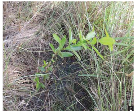
Figura 2. Plantio na área úmida. (A) Buriti plantado junto ao capim. Plantio das árvores por sementes, (B) buritirana, (C) bacaba, (D) buriti e plantada por muda (E) o landi.