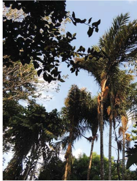
Figura 1. Vista das árvores que cobrem a chácara Terrágua

ou ter finalidade comercial. Para o sistema e para ser ecológico seria melhor nem roçar. A vantagem é econômica. Eu tenho a mandioca, então tenho o saco de farinha, que hoje está custando R$ 300. As vantagens das árvores são as frutas, a madeira também e, para mim, ainda mais é o estudo. Eu estou vendo o desenvolvimento de cada uma. Hoje eu sei, por exemplo, das exóticas, a acácia, o nim. Então tem essas questões de estudo, a resistência ao fogo...”.