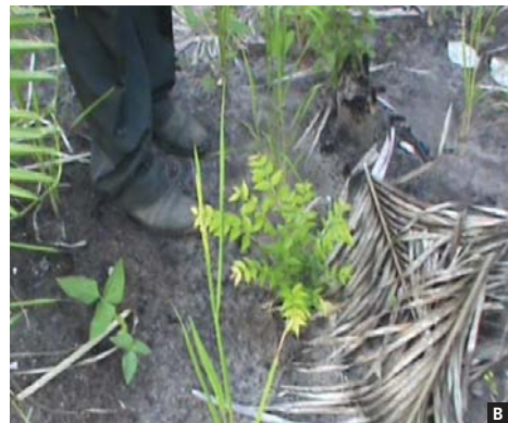
Figura 2. Plantio de roça consorciada com árvores, (A) mandioca, milho e arroz consorciados. (B) brotações naturais e plântulas de espécies madeireiras e frutíferas.