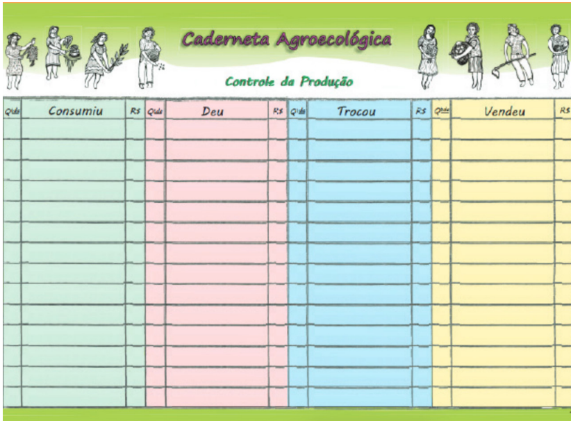
Figura 1: Página de anotações da Caderneta Agroecológica.

lor monetário de cada produto das agricultoras. As anotações devem ser feitas diariamente, indicando o mês de referência em cada página da CA para garantir o registro sistemático dos dados. Devem ser anotadas informações da produção oriundas da diversidade dos espaços de trabalho e experimentação desenvolvidos com autonomia pelas mulheres nos diferentes agroecossistemas e contextos socioambientais.